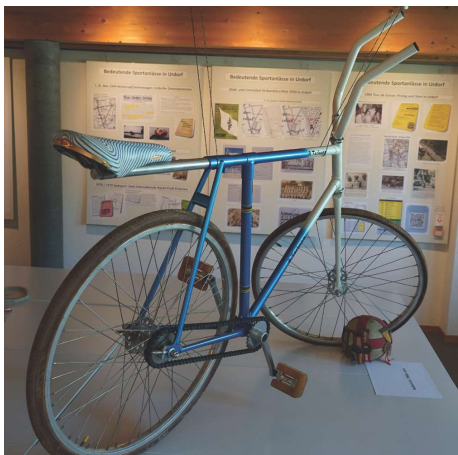
So sieht ein Radballvelo aus.

Noch viel, viel mehr Wissenswertes über den Sport in Urdorf sehen Sie auch weiterhin an den offenen Museumstagen ganz oben unter dem Museumsdach, wo Ausschnitte dieser Ausstellung präsentiert werden. Schauen Sie bei uns rein und staunen Sie! Wir freuen uns auf Ihren Besuch.